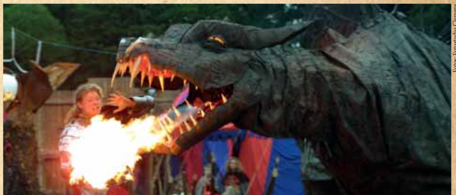
Der Freitagabend wird zur „Nacht der Mythen, Sagen und Legenden“.