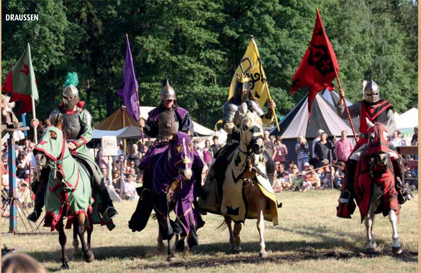
Das Ritterturnier zu Fuß und Pferde findet an allen Tagen statt.