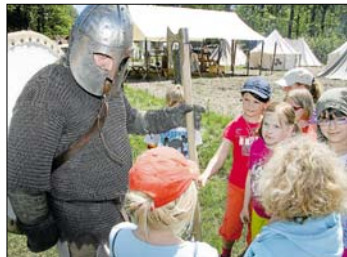
Ehrfürchtig begegneten die Schüler einem Söldner mit Schild und Streitaxt. Im Hintergrund sind die Zelte des Heerlagers zu sehen.